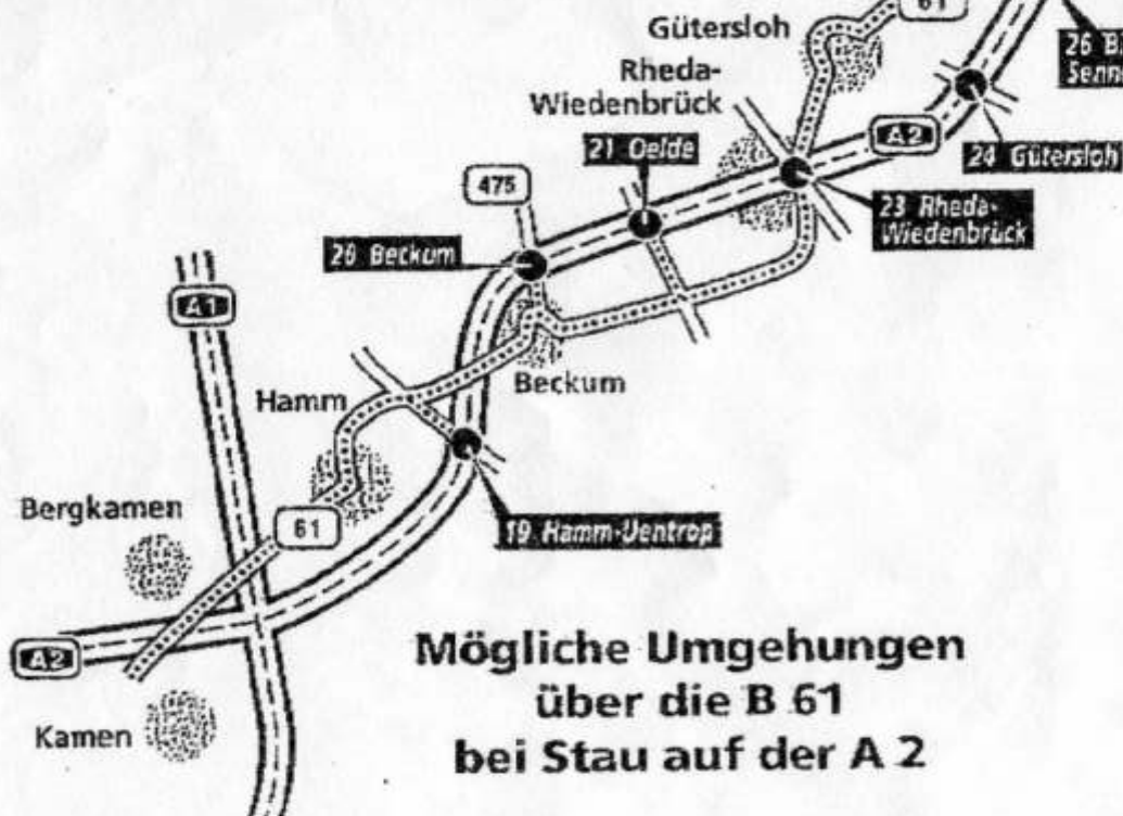
Mögliche Umgehungen über die B 61 bei Stau auf der A 2